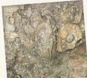
Huitres fossiles visibles depuis le sommet de la falaise.