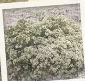
Le crambé maritime pousse sur les galets.

Sur le littoral cauchois, une vauleuse désigne une échancrure naturelle permettant aux habitants du plateau et aux pêcheurs d'accéder à la mer. A Mesnil-Val, la vauleuse a permis, avec l'avènement du tourisme, le développement d'une architecture balnéaire typique. Aujourd'hui, le site propose un lieu plus intime et une plage moins exposée que celle de Criel. En accédant au site, il est possible d'observer une flore spectaculaire, comme le crambé maritime ou diverses orchidées sauvages.