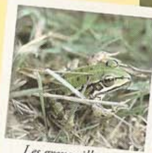
Les grenouilles sont friandes des zones humides.